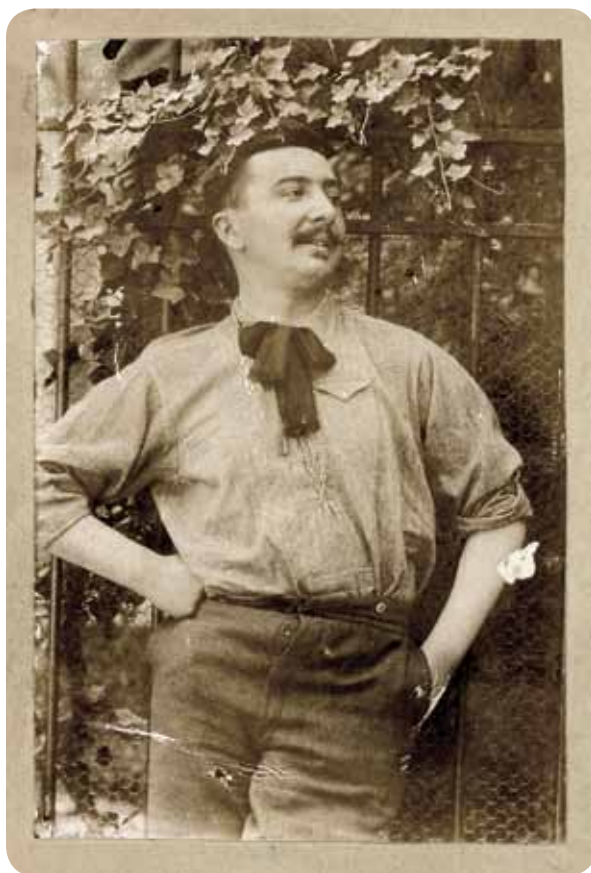
Jacques Gruber, vers 1890-1900.

Retrouvez ce parcours sur votre iPhone dans une version enrichie en saisissant “Gruber” dans l’Apple store ainsi que sur le site www.ecole-de-nancy.com